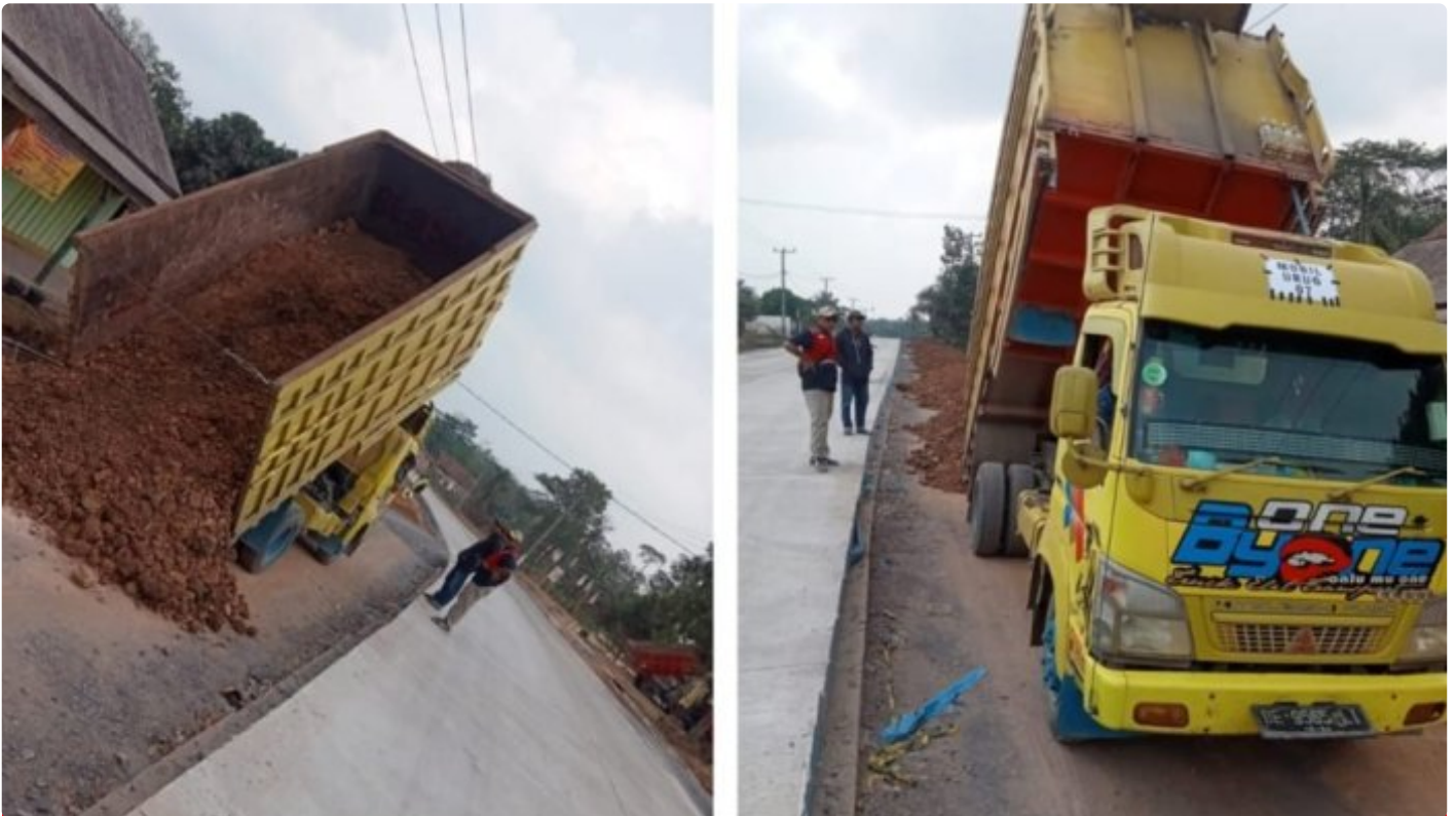
Mobil Pengangkut Tanah Galian C