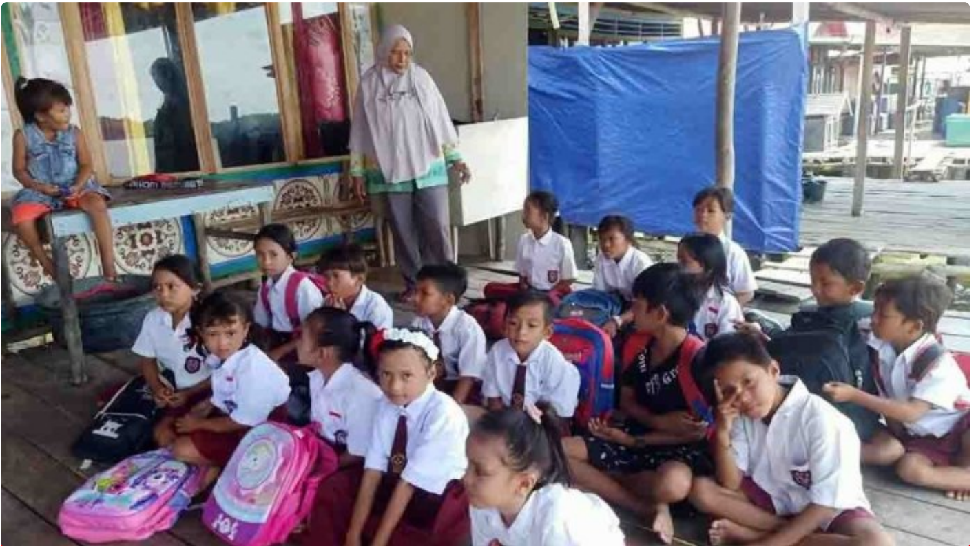
Pengabdian Seorang Guru di Desa Terpencil

LAMPUNG - Peringatan hari guru tahun ini semoga menjadi momentum yang tepat dan strategis untuk menatap masa depan pendidikan Indonesia yang lebih baik. Tantangan dan masalah yang sedemikian kompleks membutuhkan pemikiran yang mendalam. Guru sebagai garda terdepan harus terus menerus berbenah diri untuk mencerdaskan kehidupan bangsa. Pun negara harus hadir memperbaiki taraf hidup guru khususnya bagi guru honorer yang berada di Daerah 3T (Tertinggal, Terdepan dan Terluar).